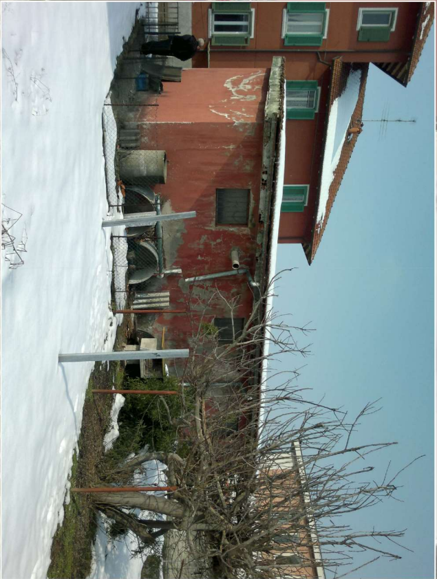
MAGAZZINO - Retro (est)