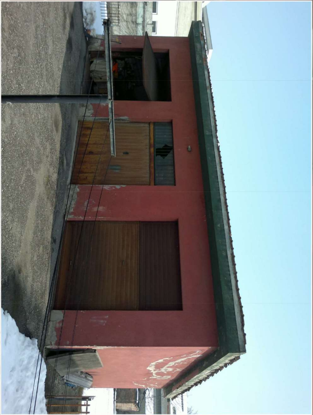
MAGAZZINO - Prospetto principale (ovest)