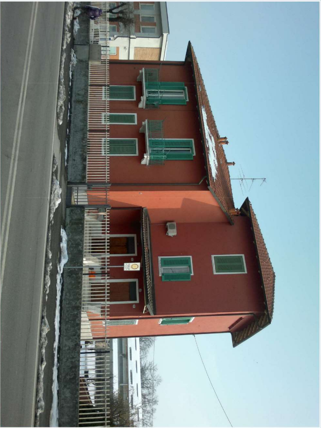
PROSPETTO PRINCIPALE (ovest)